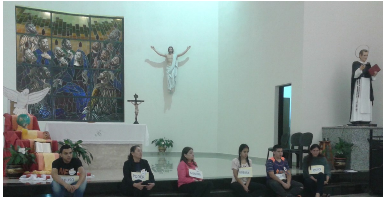
PENTECOSTÉS EN LA CAPILLA "ESPIRITU SANTO"- LUQUE.

Los días 10 al 15 de mayo pudimos visitar la comunidad de Luque ; tuvimos la oportunidad de compartir la vida y el ritmo de la comunidad, participar de la fiesta de Pentecostés con la comunidad escolar y eclesial. Una fiesta muy bien preparada por las Hermanas, con distintos momentos, además que la Capilla está dedicada al Espíritu Santo.