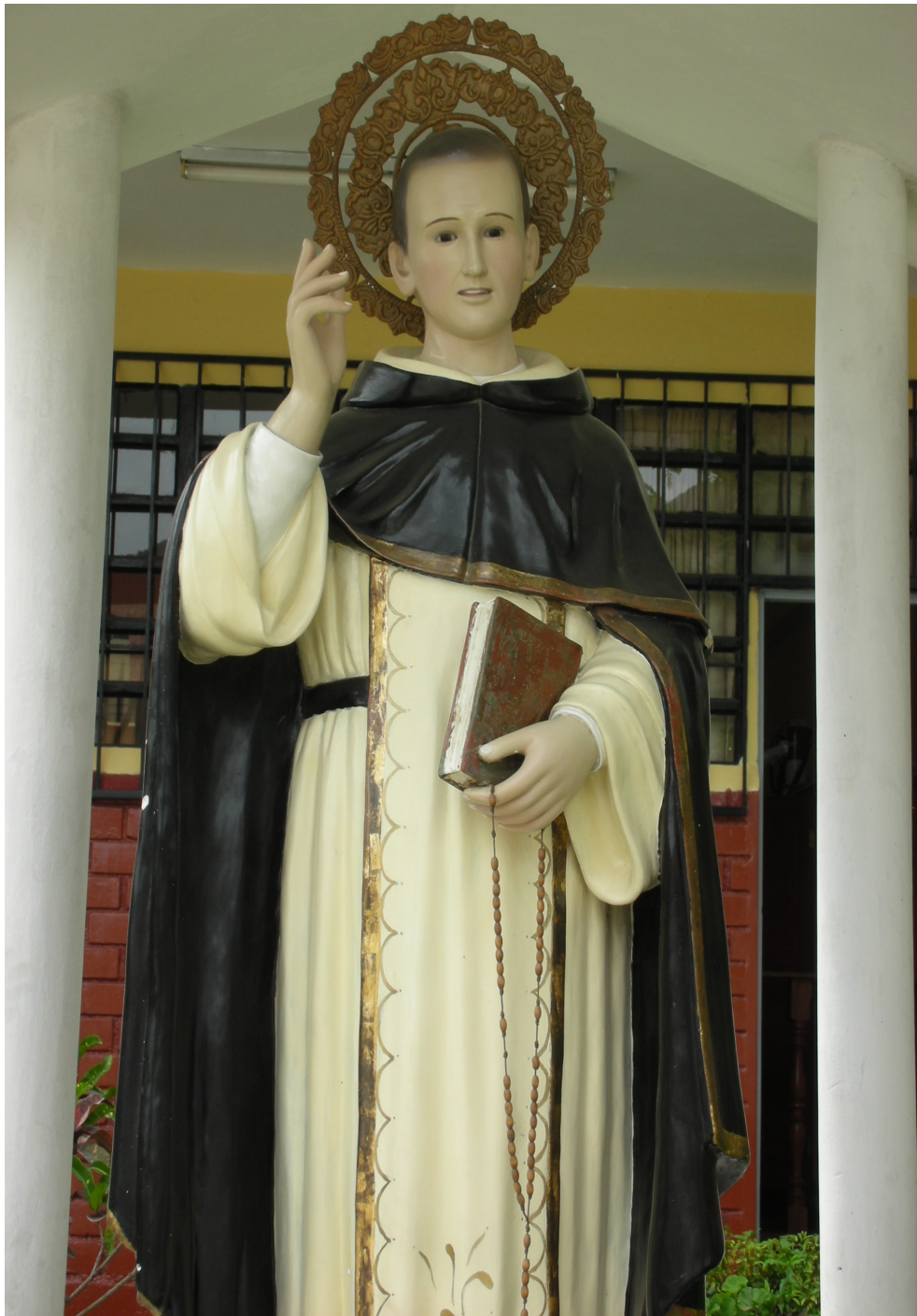
SAN FRANCISCO COLL FE y ALEGRÍA Nº 39