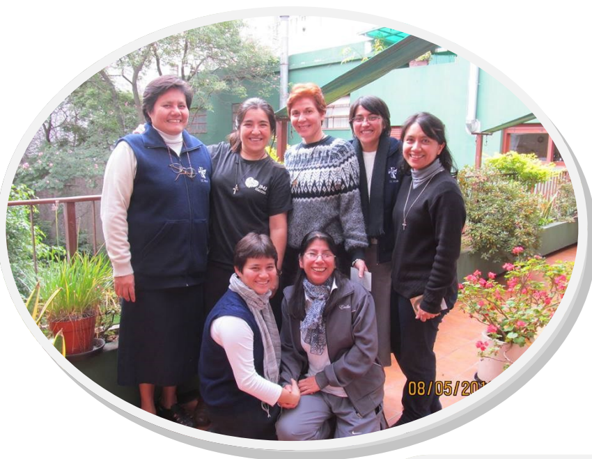
HNAS PJV ARGENTINA

En la línea de la prioridad sobre la vida y misión compartida con los laicos queremos ir integrando a este equipo jóvenes que comparten este espacio con nosotras y seguir pensando juntos este gran campo de trabajo.