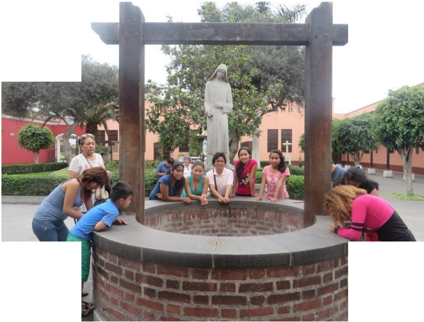
Hermanas Dominicas de la Anunciata - Perú