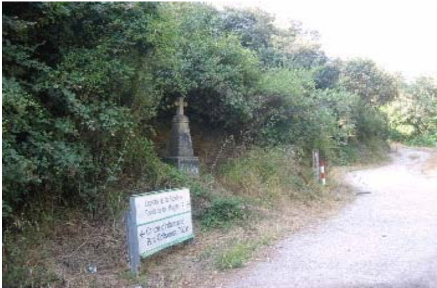
Monumento existente en el lugar del martirio de las Hnas: