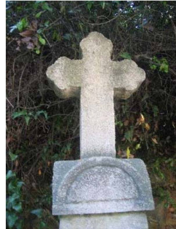
Cruz del monumento erigido en el lugar del martirio de las cinco Hermanas de la calle Trafalgar